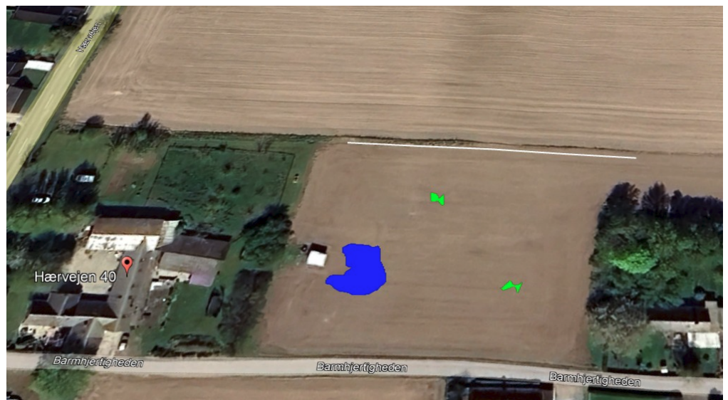
Kort 1 Søernes placering

Adresse: Hærvejen 40, 4660 Store Heddinge Matrikel: 4k, Tommestrup By, St. Heddinge